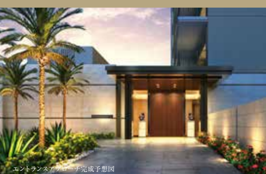
エントランスアプローチ完成予想図