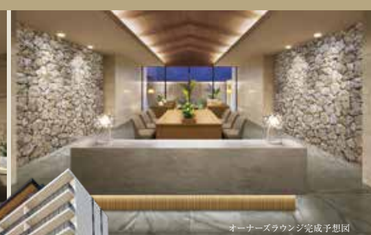
オーナーズラウンジ完成予想図