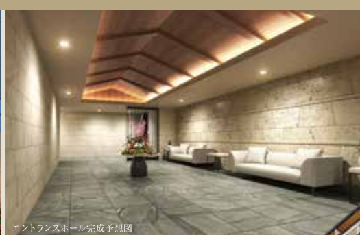
エントランスホール完成予想図